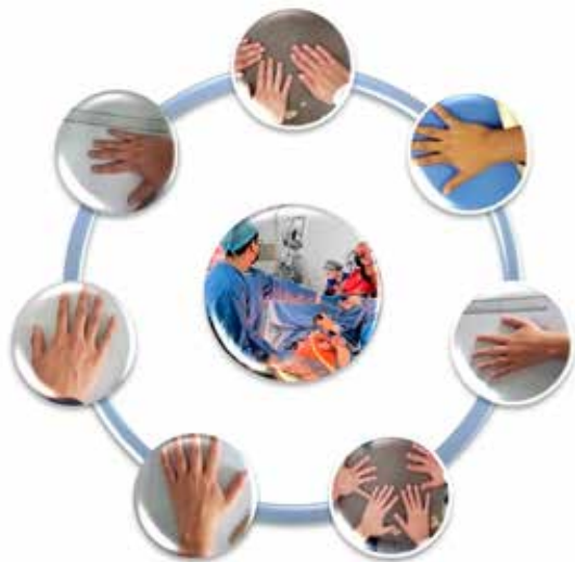
Fotografías de las manos de los médicos residentes (ambos sexos)

Se les pidió que dibujar el contorno de sus manos y se tomó fotografías para observar el tamaño y mostrar que éstas, al ser un menor tamaño, es necesario contar con instrumental acorde y que sea ergonómico, ligero, que cuente con las características como el instrumental similar al de la cirugía robótica.