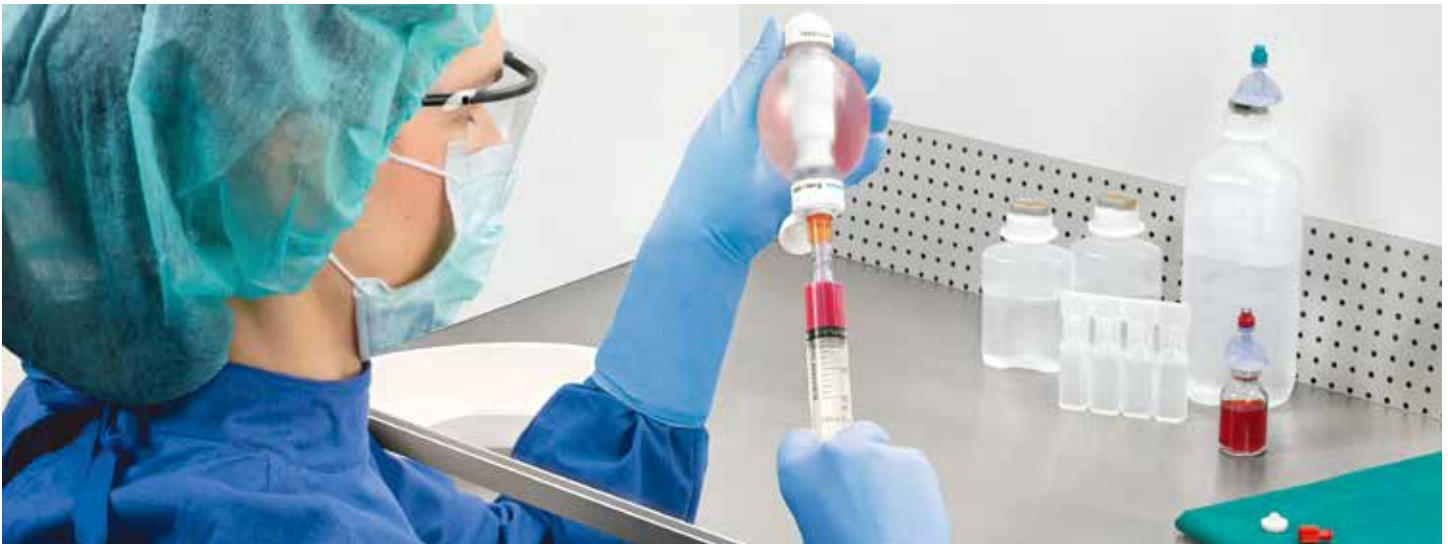
Fig. 2 Preparación en un ambiente segregado (CFL) pero sin ambiente clasificado alrededor de este.

Lo cual solo se logra en un centro de mezclas bien establecido. Esto permitirá asignar una fecha límite de uso hasta de 7 días en refrigeración o 4 días a temperatura ambiente controlada (20 a 25°C) desde el punto de vista microbiológico. 2