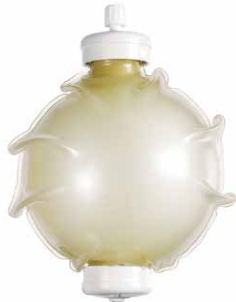
Fig. 3 Infusor en proceso de inspección visual, donde se nota la ausencia de precipitados o partículas.

La inspección final del infusor es importante, en un fondo claro-oscuro para validar de manera visual que no presenta partículas en el momento de entrega.