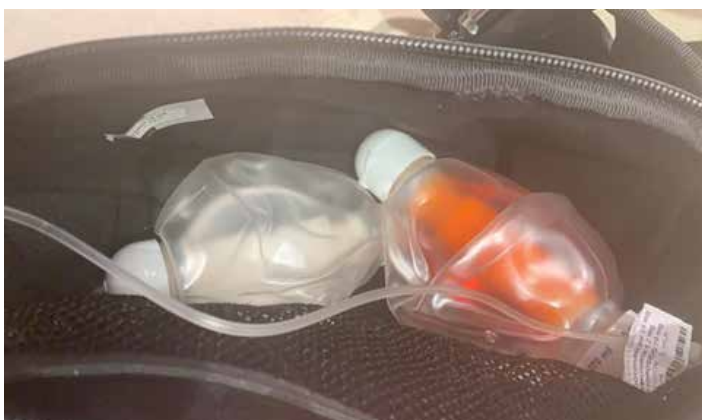
Fig 4. Esta fotografía muestra la portabilidad de los infusores en una bolsa "cangurera"

Es recomendable proporcionar al paciente ideas para el transporte y colocación del infusor, como una cangurera donde pueda ir revisando sus dispositivos y portarlos con mayor comodidad, como se observa en la Fig. 4