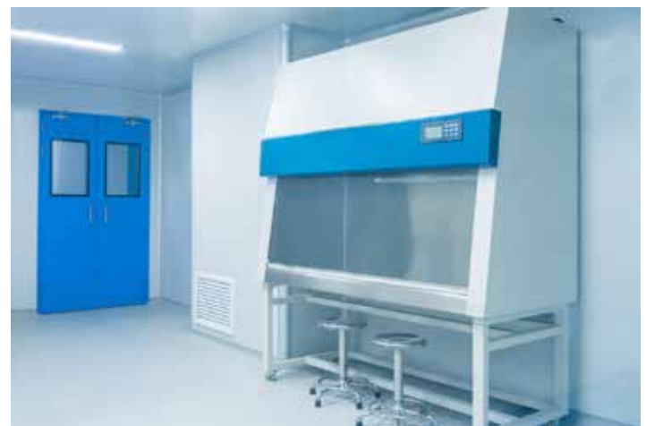
Fig. 1 Aspecto de un cuarto de preparación de mezclas estériles (centro de mezclas) donde se observa que las instalaciones alrededor del equipo de preparación también tienen el aire clasificado y acabado tipo sanitario que reduce la biocarga del área de preparación.

Idealmente y en cumplimiento con la NOM-249, el ambiente debe estar monitorizado microbiológicamente, tanto en el área de preparación (CFL o GSB) y en el entorno inmediato, es decir, el cuarto donde están situados estos equipos también debe contar con filtración de aire y condiciones que lo sitúen en clase B, teniendo un control de la preparación para asegurar que la preparación es estéril, como se observa en la Fig.1 Además de que el profesional que realiza la preparación tenga su técnica de preparación validada previamente. 1