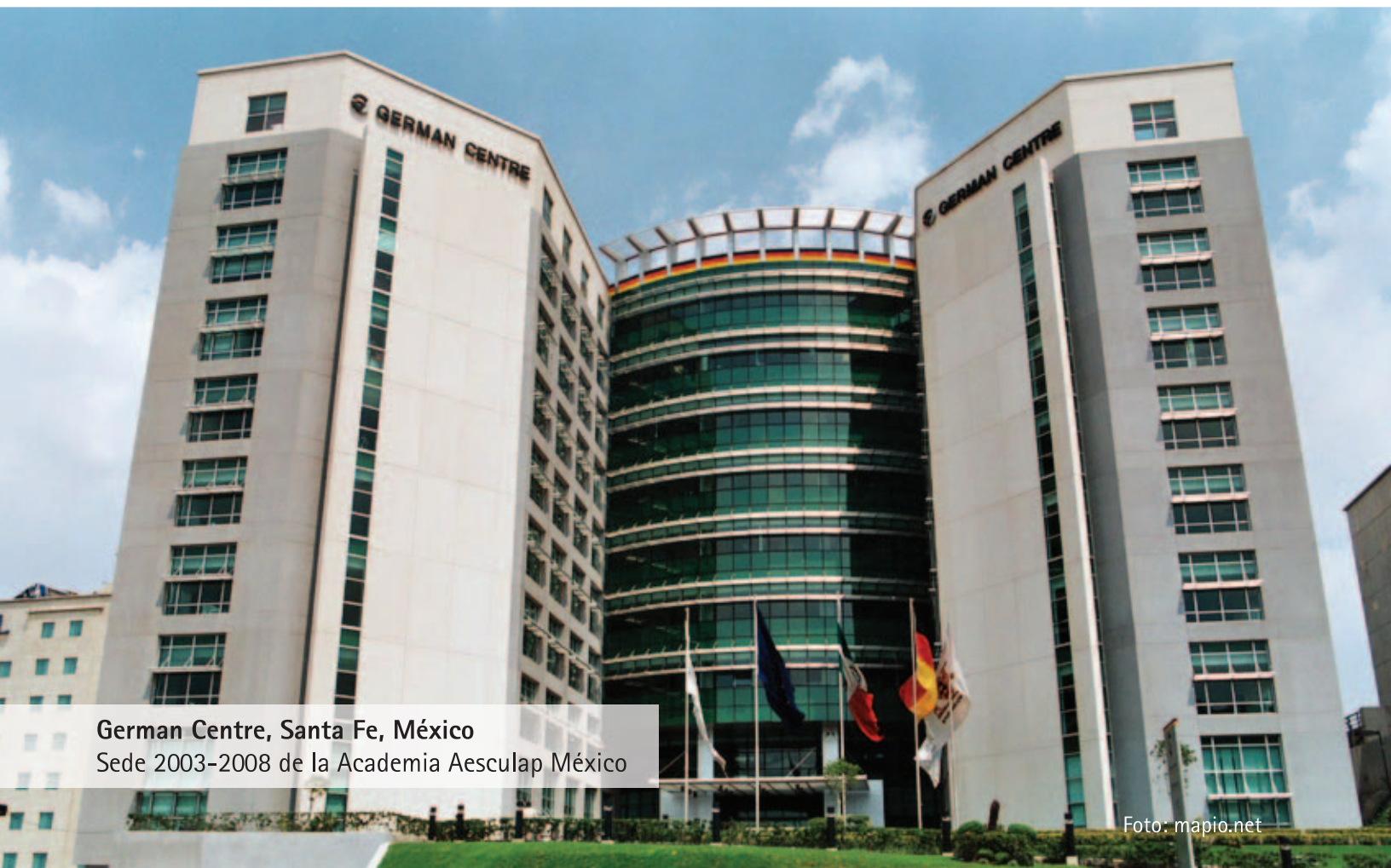
German Centre, Santa Fe, México Sede 2003-2008 de la Academia Aesculap México