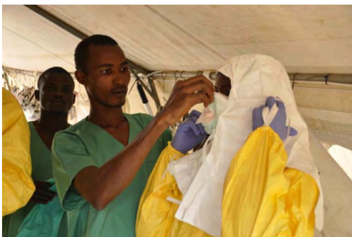
Miembros del equipo poniéndose el traje protector antes de entrar.

Esta terrible enfermedad viral debe su escalofriante reputación no tanto a las más de 1500 víctimas mortales que se han registrado desde su descubrimiento en 1976 ; sino más bien a factores como su elevado índice de letalidad del 90% , a su breve periodo de incubación , a la facilidad con que se transmite pero sobre todo al hecho de que no existe cura ni tratamiento efectivo al día de hoy.