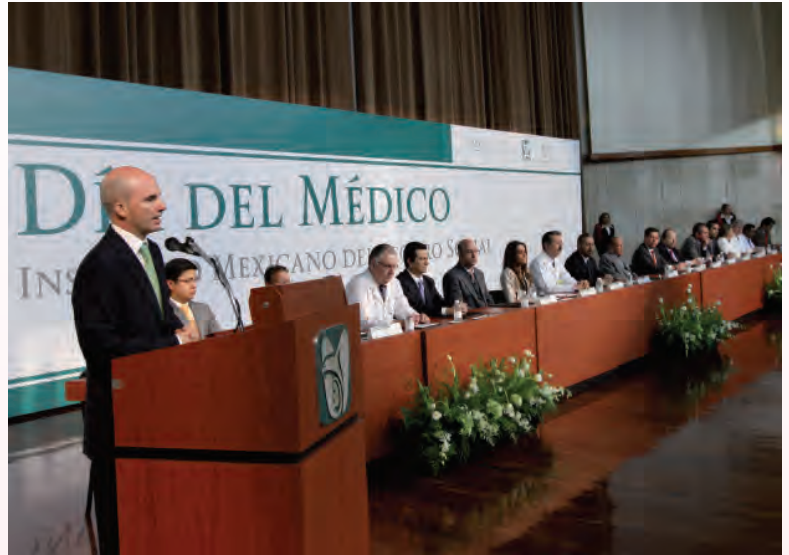
Dr. José Antonio González Anaya Director del IMSS